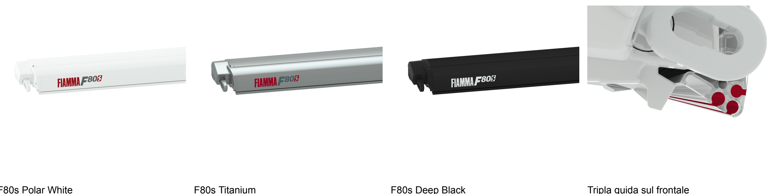
F80s Polar White F80s Titanium F80s Deep Black Tripla guida sul frontale

* Attenersi alle lunghezze consigliate perché vincolate dai punti predisposti dalla casa costruttrice