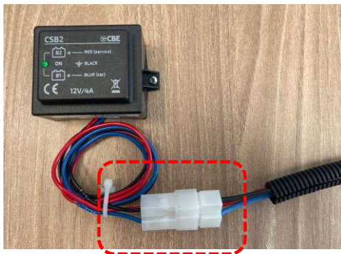
CSB2 p/n 205025