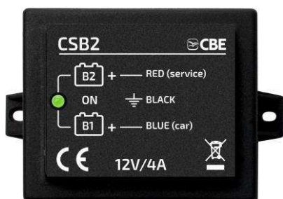
CSB2 p/n 205025