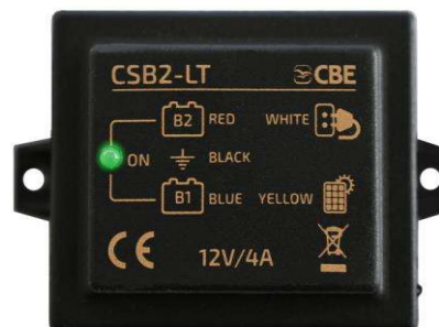
CSB2-LT p/n 205026