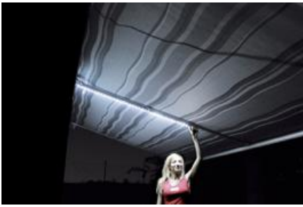
Rafter LED Caravanstore