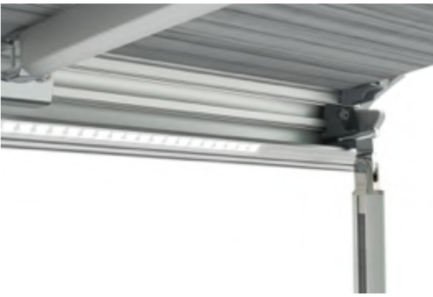
Kit LED Strip Awning