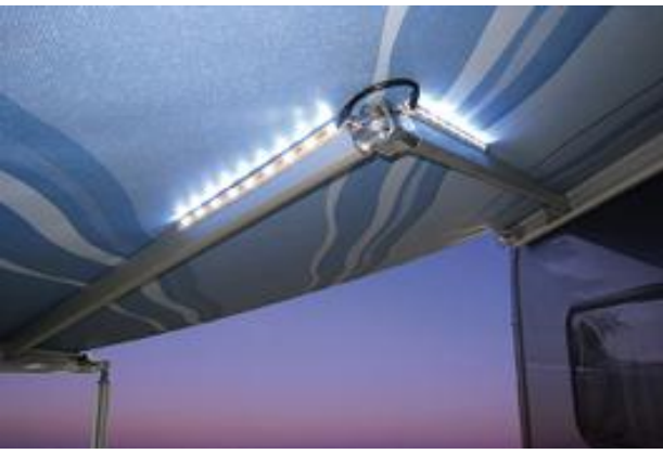
Awning Arms LED