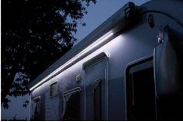
LED Awning Case